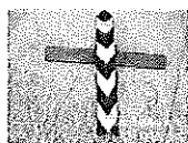
大量批发80公分直角 橡胶护墙角 柱体墙角 批发价: ¥ 5.30