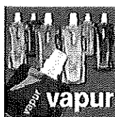
厂家直销带折伞水袋 折叠水壶 水壶袋 户外 批发价: ¥ 1.10