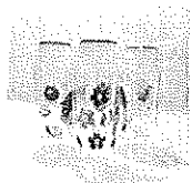
太空杯批发 大容量 1000ML运动水壶 塑料 批发价: ¥3.18