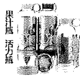
新品促销正品 活力脆 韩国柠檬杯 榨器果汁 批发价: ¥33.00