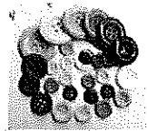
金属圆形急扣塑料纽扣 弹簧绳扣衣角掌帽钉扣 批发价: ¥0.04